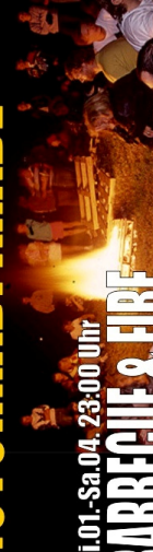
Mi.01.-Sa.04. 23:00 Uhr