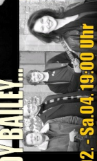
Mi.02. - Sa.04. 19:00 Uhr ...WORSHIP BAND WIR...