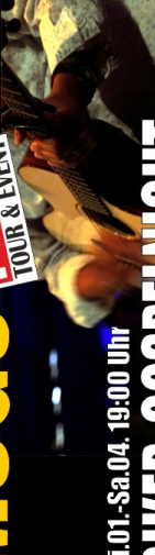
Mi.01.-Sa.04. 19:00 Uhr