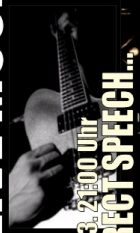
Fr.03. 21:00 Uhr ...DIRECT SPEECH...