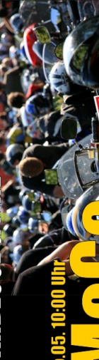
So.05. 10:00 Uhr