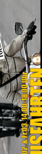
Do.02. & Fr.03. 14:00-18:00 Uhr