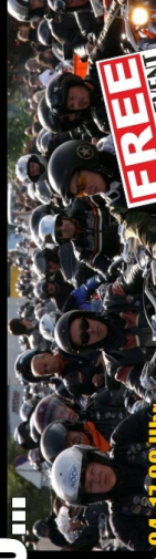
Sa. 04. 17:00 Uhr